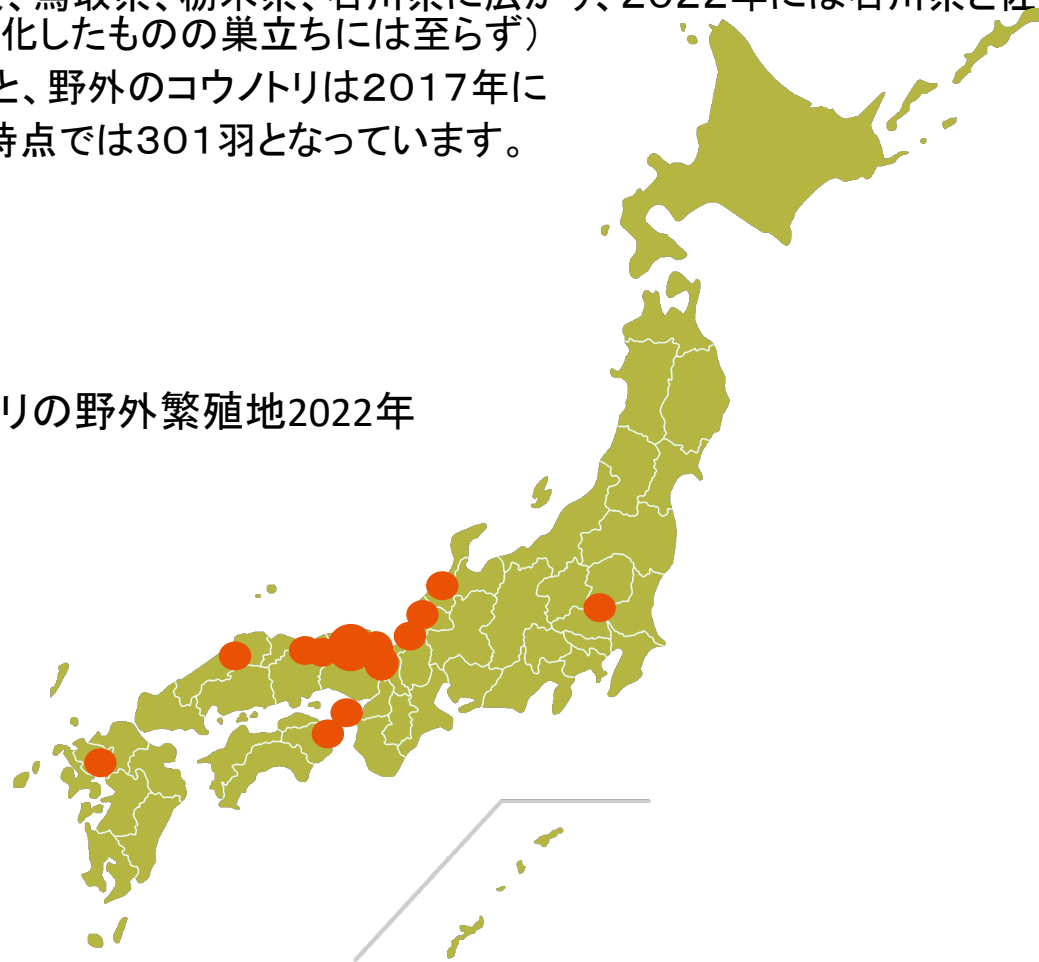
コウノトリの野外繁殖地2022年

兵庫県立コウノトリの郷公園によると、野外のコウノトリは2017年に100羽を超え、2022年7月31日時点では301羽となっています。